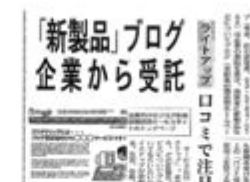
日経産業新聞にブログプロモーション掲載