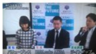
ワールドビジネスサテライトでJマッチ放映