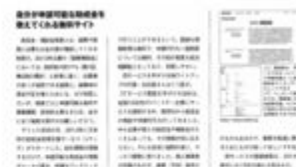
アントレにJマッチ掲載