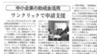
日経産業新聞にJマッチ掲載