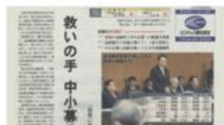
フジサンケイBusiness iに自社メディア掲載